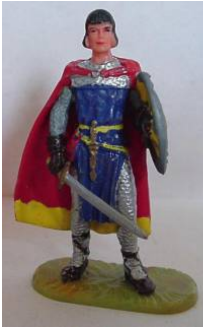
Abb.8: Prinz Eisenherz in Elastolin