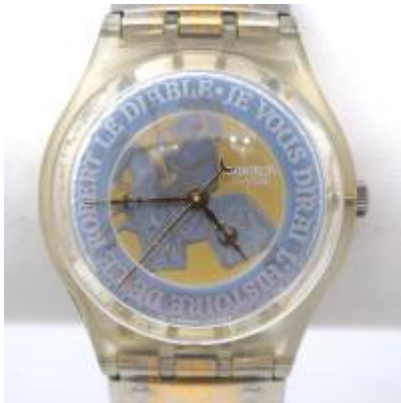
Abb.2: Swatch Uhr