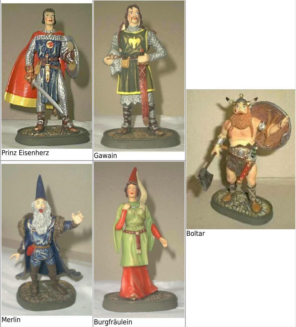
Abb.11: fünf Figuren einer von Bulls, Kings Features Syndicate, herausgegebenen Sonderserie. Jede Figur ist ca. 14 cm hoch und auf 120 Kopien limitiert. Zumindest die Eisenherz-Figur ist ein Abguß vom Modell des Chefmodelleurs Weißbrodt der Firma Hausser. Infos bei Fanseite Elastolin/Hausser .

Basisinformationen habe ich im Artikel Elastolinfiguren zusammengestellt. Allerdings werde ich dieses Thema nicht weiterverfolgen!