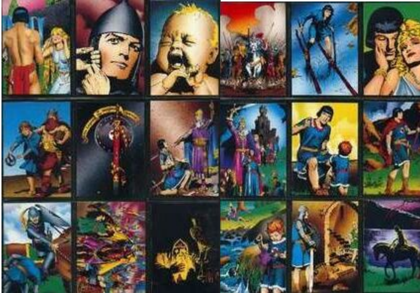
Abb.3: Sammelkarten (Auszug)