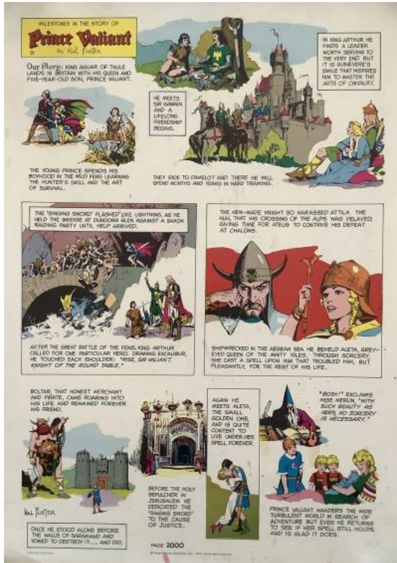
Abb.4: Sonderdruck Seite 2.000