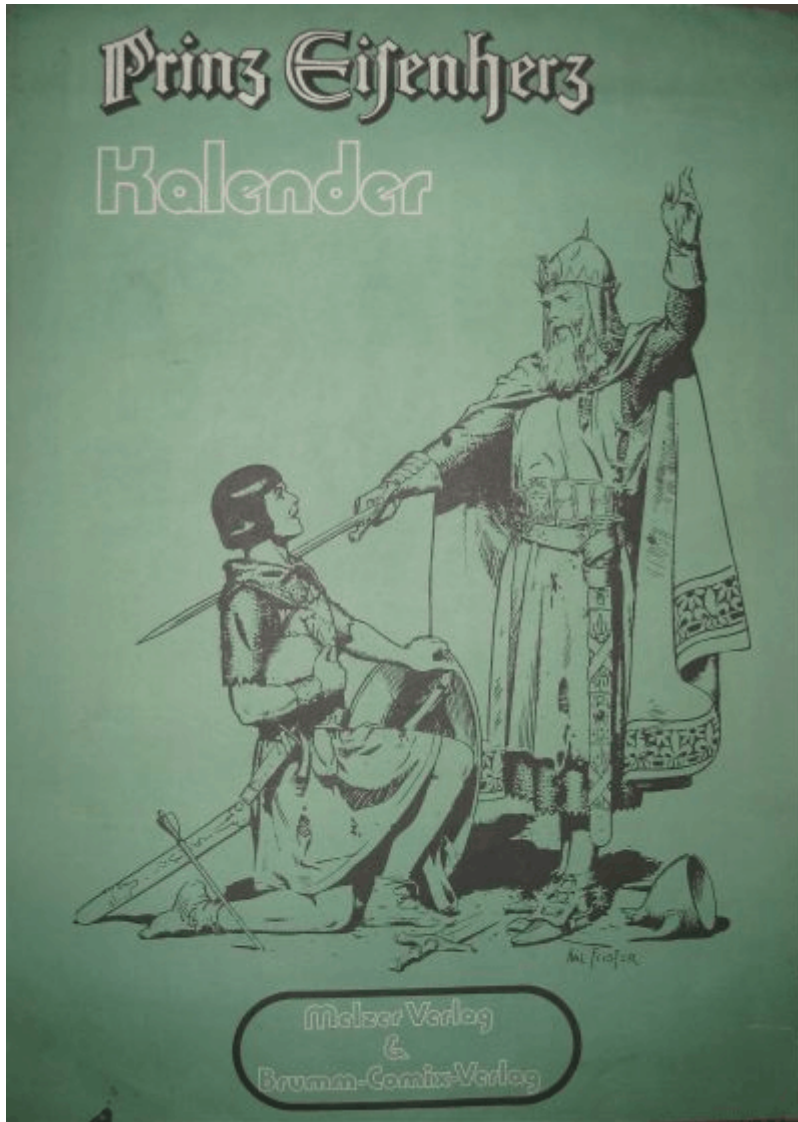
Abb.3: Kalender 1972

Dieser Kalender aus dem Hause Melzer ist nie regulär verkauft worden. Er zeigt den Kampf den jungen Eisenherz gegen den roten Ritter .