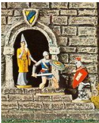
Abb. 6: Prinz Eisenherz verteidigt ein Burgfräulein (aus einem Hauser Elastolin-Katalog)