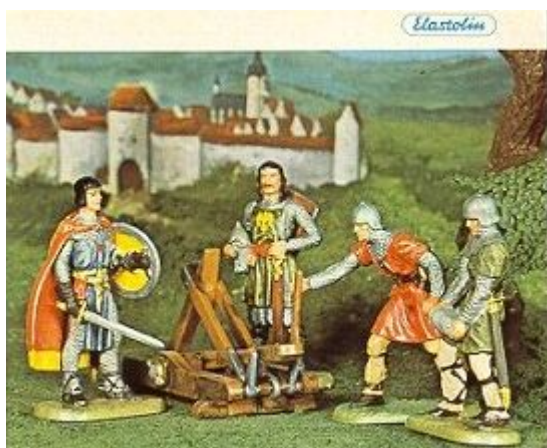
Abb. 5: Prinz Eisenherz und Gawain aus einem Hauser Elastolin-Katalog