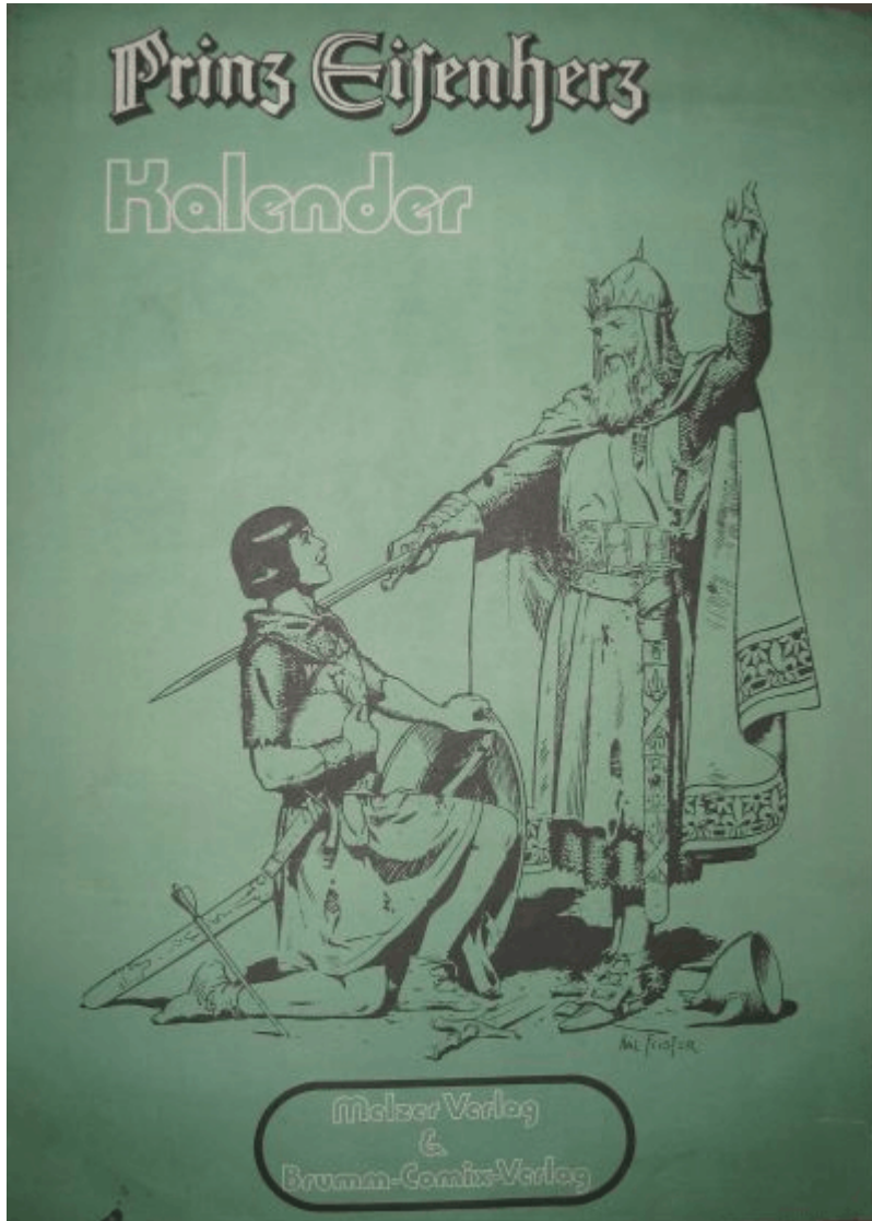
Abb.3: Kalender 1972

Dieser Kalender aus dem Hause Melzer ist nie regulär verkauft worden. Er zeigt den Kampf den jungen Eisenherz gegen den roten Ritter .