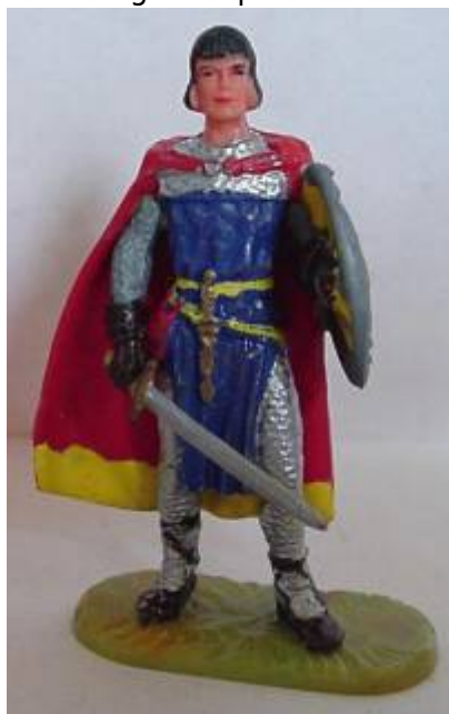
Abb. 4: Prinz Eisenherz in Elastolin