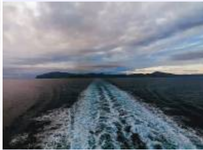
Bild 2: Die Insel Amorgos wie man sie von der Fähre aus sieht, Blickrichtung aus Nordwest nach Südost.