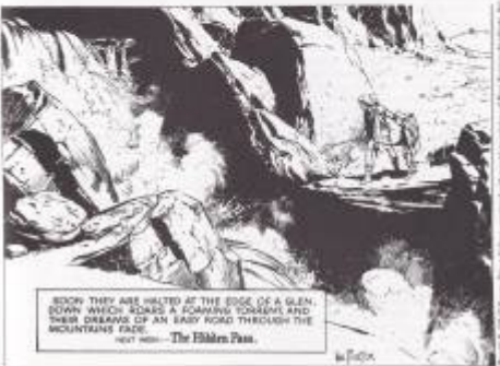
SOON THEY ARE HIJACKED AT THE EDGE OF A GLEN, DOWN WHICH ROLLS A FORMIDABLE TORMANT AND THEIR DREAMS OF AN EASY HOME THROUGH THE MOUNTAINS FADE. —The Hidden Pass.