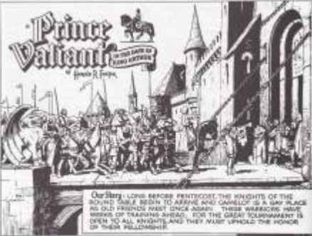
Our Story: LONG BEFORE PENTECOST, THE KNIGHTS OF THE ROUND TABLE BEGAN TO ARRIVE AND GALLEY IS A GAP PLACE OLD FRENCH FIGHT ONCE AGAIN. THESE WARRIORS HAVE WORDS OF TRAINING AHEAD. FOR THE GREAT TOURNAMENT IS OPEN TO ALL KNIGHTS AND THEY MUST UNFOLD THE HONOR OF THEIR KINGDOMS.