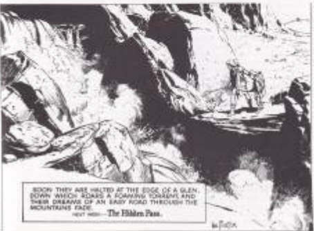
SOON THEY ARE HELD AT THE EDGE OF A GLEN, DOWN WHICH ROLLS A FOAMING TORRENT, AND THEIR DREAMS OF AN EARLY MORN THROUGH THE MOUNTAINS FADE. —The Hidden Pass.